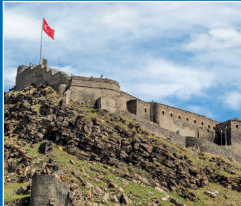
GEZELİM - GÖRELİM KARS KAPI KENTİ