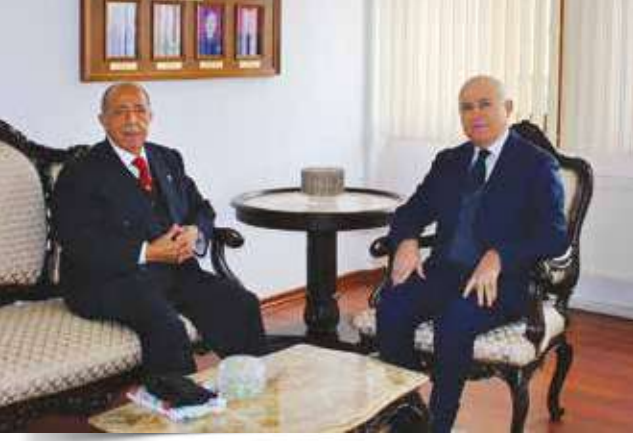
Korgeneral (E) Dursun BAK; 26 Aralık 2019