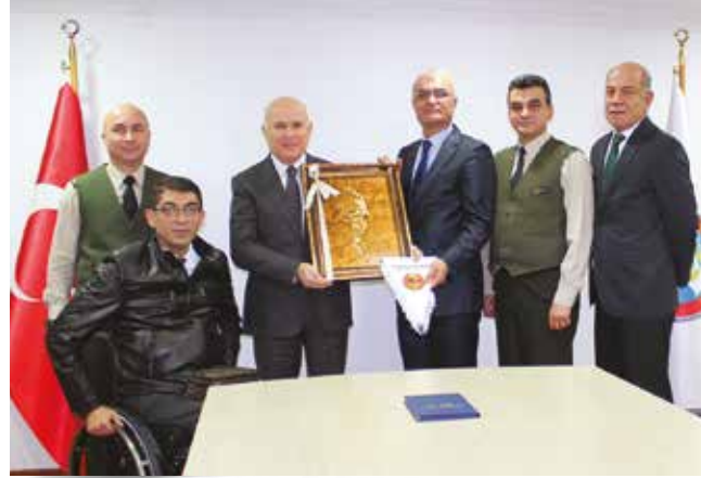
TSK Rehabilitasyon Merkezi Engelliler Spor Kulübü Yöneticileri; 30 Aralık 2019