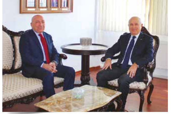
Tümgeneral (E) Ergüder TOPTAŞ; 06 Kasım 2019